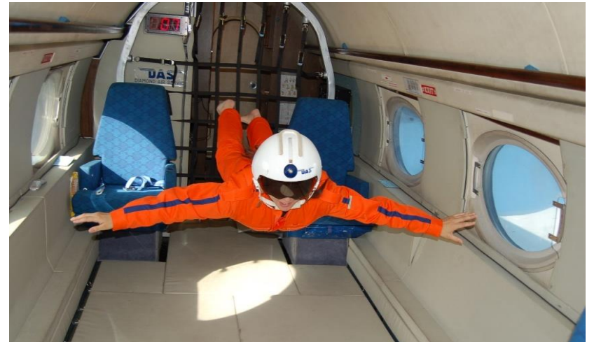
無重力体験の様子