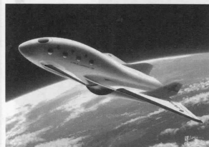
宇宙飛行機のイメージ

従来の政府主導による重厚長大なロケット開発ではなく、民間主導による、ベンチャーならではの自由な発想、ネットワークでの開発を行う。市場開拓においても、科学、研究、観測のみならず、エンターテインメントなど新しい市場を積極的に切り開いていく。