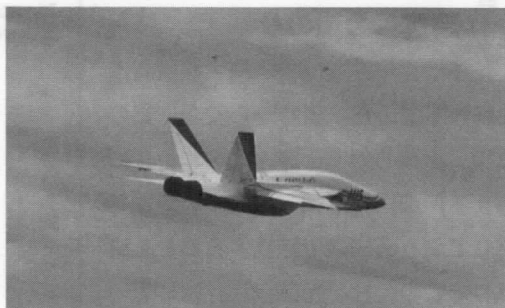
実験機「X02」のテスト飛行

高高度の大気観測、微小重力実験のほか、弾道（サブオービタル）宇宙旅行などのサービスを提供する。